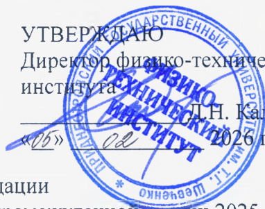
График ликвидации академических задолженностей по итогам зимней промежуточной сессии 2025-2026 учебного года (первая повторная промежуточная аттестация) обучающимися очной формы обучения Физико-технического института (инженерно-технический факультет) Сроки проведения: «09» февраля 2026 г. – «28» февраля 2026 г.